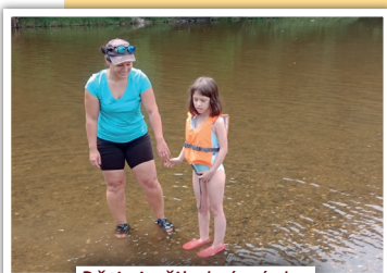
Děti si užily krásný den koupáním v řece Berounce

Díky grantu společnosti Philip Morris hradíme svozy a rozvozy žáků do školy a také dopravu na veškeré aktivity žáků. Tentokrát jsme se vydali koupat k řece Berounce do kempu Višňová. Kromě příjemného zchlazení v řece jsme si opékali špekáčky a užili si krásný slunečný den. Cestou zpět jsme ještě měli zastávku u hradu Křivoklát a občerstvení se zmrzlinou. Výlety podporují sociální integraci, smyslovou stimulaci, sebevědomí a komunikační dovednosti žáků.